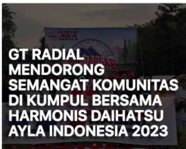
GT RADIAL MENDORONG SEMANGAT KOMUNITAS DI KUMPUL BERSAMA HARMONIS DAIHATSU AYL A INDONESIA 2023