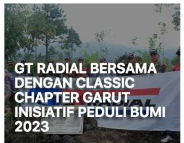
GT RADIAL BERSAMA DENGAN CLASSIC CHAPTER GARUT INISIATIF PEDULI BUMI 2023