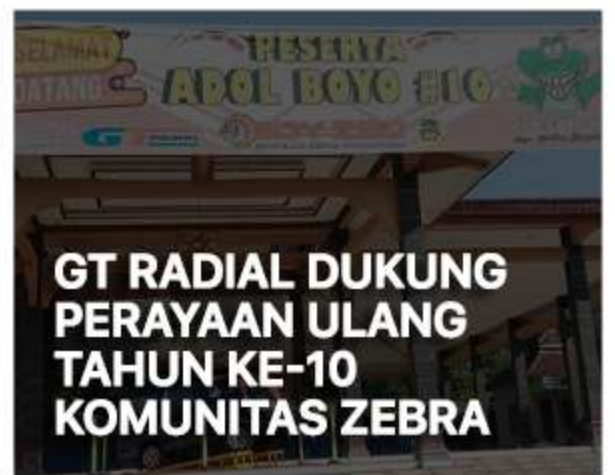
GT RADIAL DUKUNG PERAYAAN ULANG TAHUN KE-10 KOMUNITAS ZEBRA