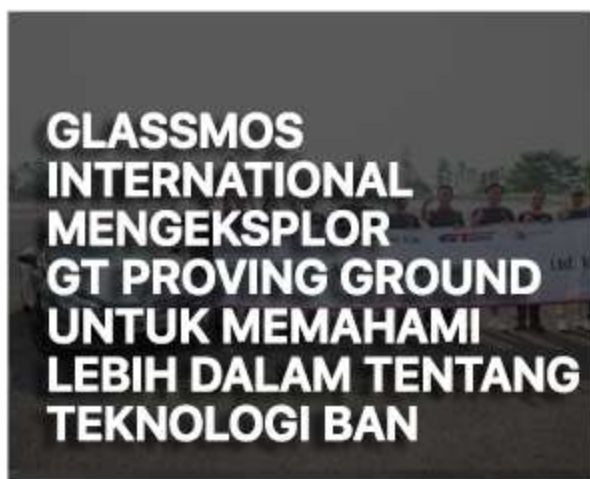
GLASSMOS INTERNATIONAL MENGEKSPLOR GT PROVING GROUND UNTUK MEMAHAMI LEBIH DALAM TENTANG TEKNOLOGI BAN