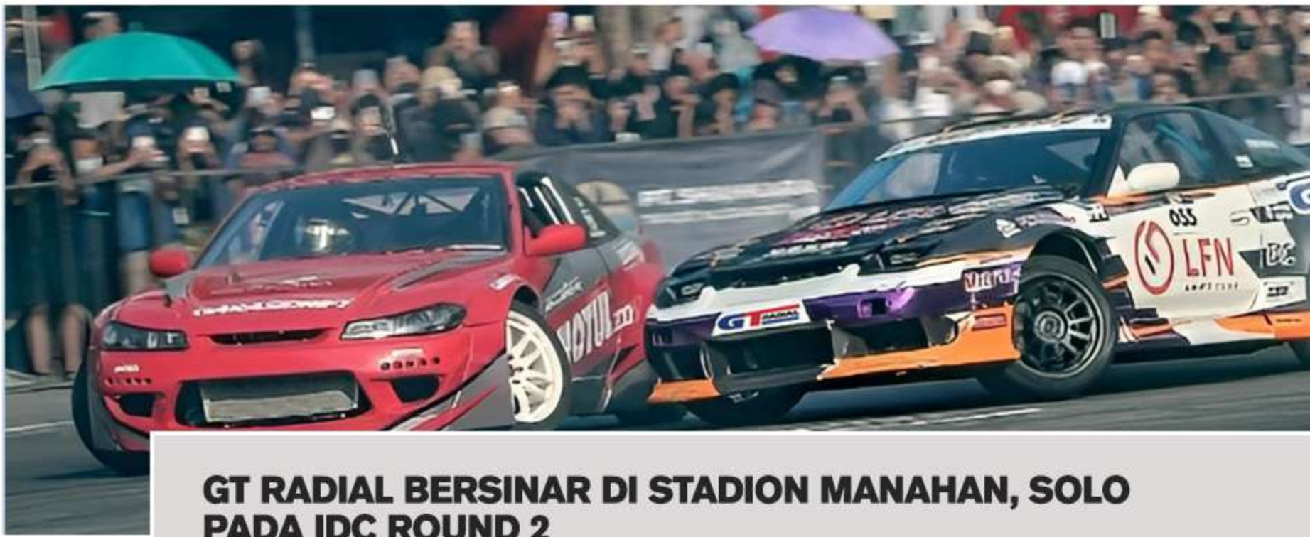
GT RADIAL BERSINAR DI STADION MANAHAN, SOLO PADA IDC ROUND 2