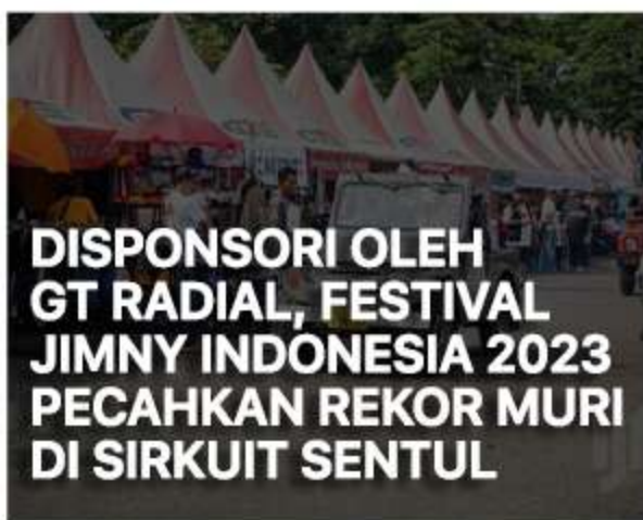
DISPONSORI OLEH GT RADIAL, FESTIVAL JIMNY INDONESIA 2023 PECAHKAN REKOR MURI DI SIRKUIT SENTUL