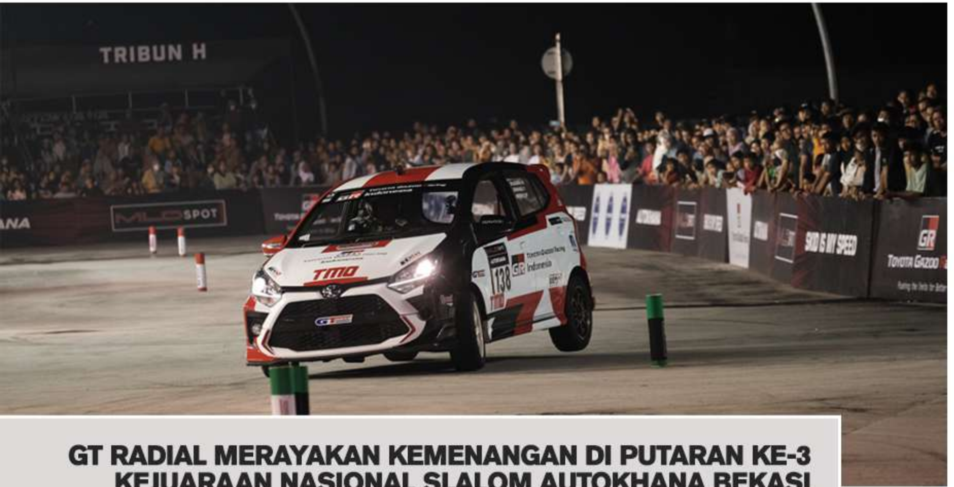
GT RADIAL MERAYAKAN KEMENANGAN DI PUTARAN KE-3 KEJUARAAN NASIONAL SLALOM AUTOKHANA BEKASI